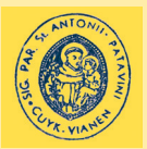
H. Antonius van Padua - Vianen